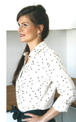
8-LA CHEMISE SEPTEMBRE COL ROND