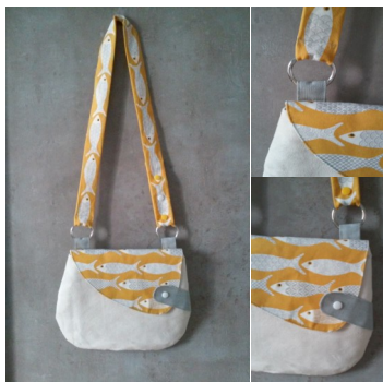
1-La besace Lalie