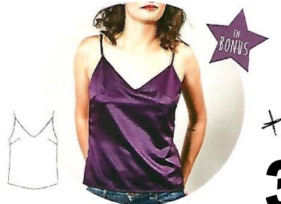
2-Le top Physalis