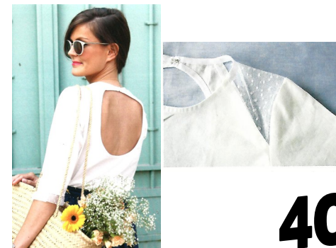
4-La blouse romantique