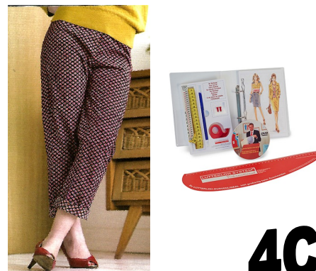
7-LE PANTALON AVEC LA METHODE COUPE D'OR