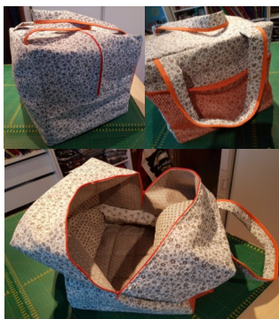
5-LA HOUSSE DE SURJETEUSE