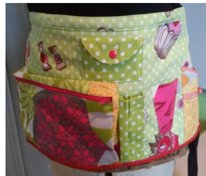
3-Le tablier de couturière