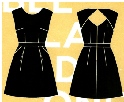
9-LA ROBE BELLA